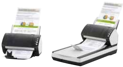
fi-7140 / fi-7240 – A4 vertical a 300 ppp 40 ppm / 80 ipm Digitalice lotes mezclados mediante el alimentador de 80 hojas